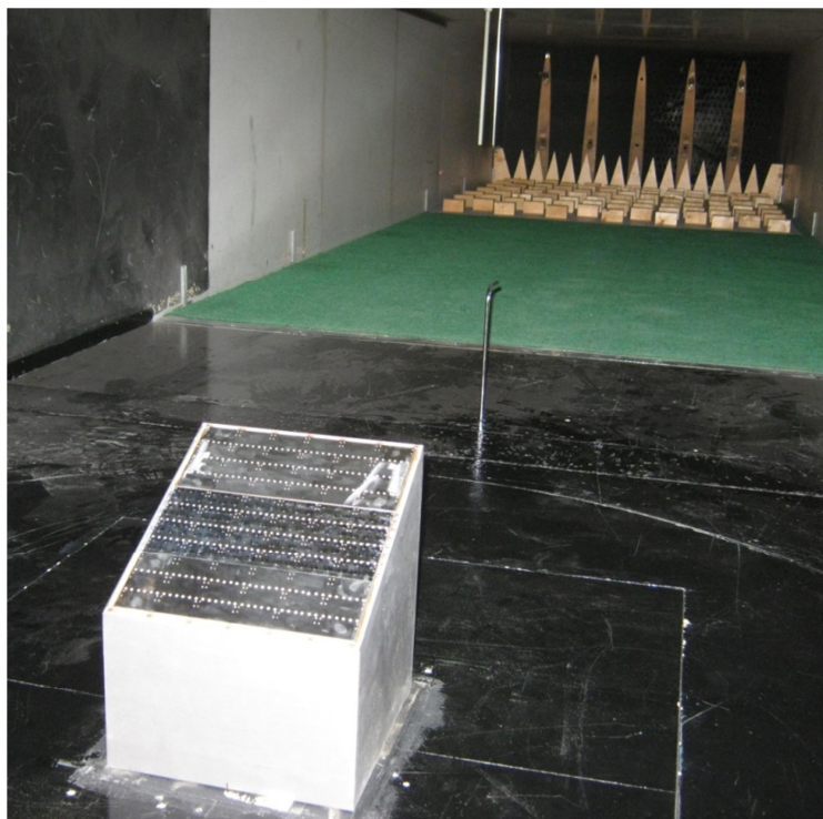
Bild 1.2: Windkanalmodell einer Feldanordnung des dachparallelen PV-Systems ILZOCLIP auf einem Pultdach mit 25° Dachneigung bei belegten Eck- und Randbereichen